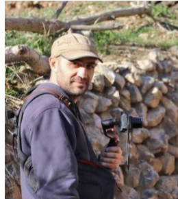
Ebrahim Mirmalek Φωτογράφος Ιράν