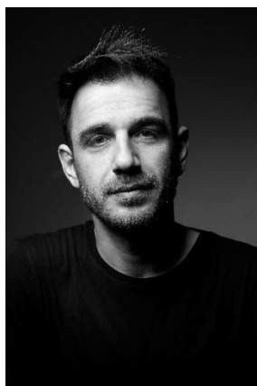
Erenik Beqiri Σκηνοθέτης | Αλβανία