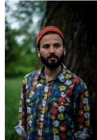
Davide Tisato Σκηνοθέτης Ελβετία - Ιταλία